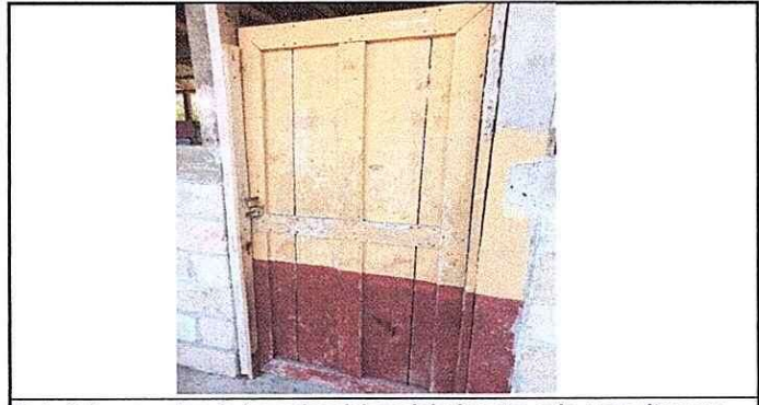
Foto 6. Las puertas de las aulas del modulo 3 y otra aula, necesitan ser reparadas ya que son de madera.

Observación: Si es necesario se pueden agregar hojas adicionales y actualizar el número de hojas.