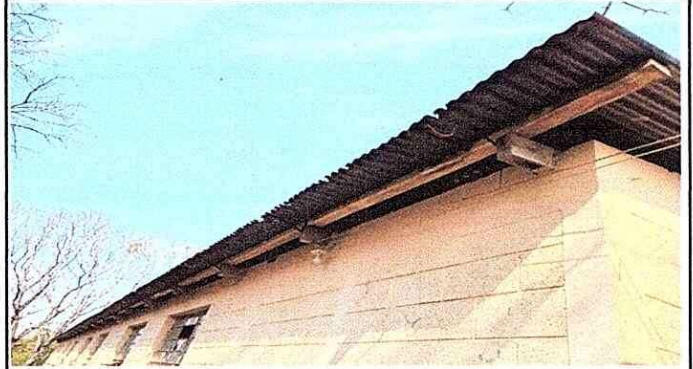
Foto 2. Módulo 2. Parte de atrás, las laminadas ya empezaron a gotear.