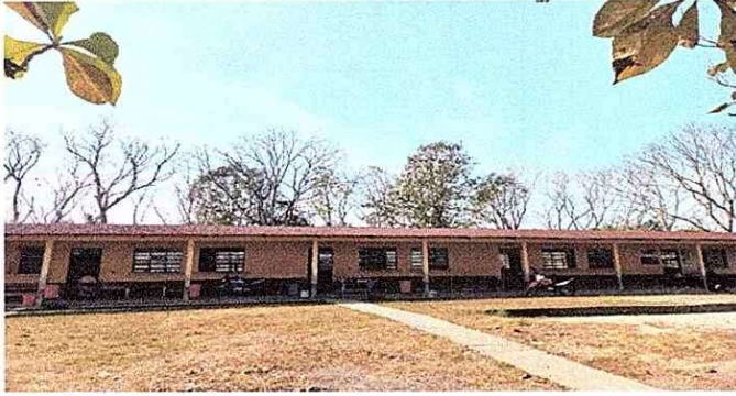
Foto 1. Módulo 1. Parte frontal, laminas oxidadas.