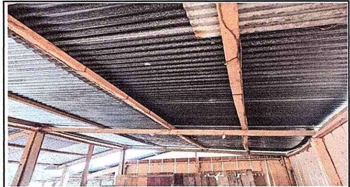
Foto 4. Aula de madera, parte interna. Estructura de madera y laminas en mal estado y agujeradas.